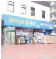
2 ハックドラッグ根岸駅前店