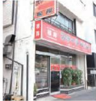
9 ステーキハウス根岸