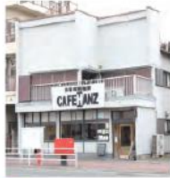
16 自家焙煎珈琲カフェアンズ