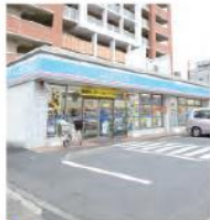
6 ローソン 横浜磯子東町店