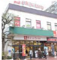
1 東急ストア 根岸店