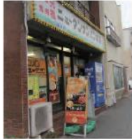
12 元祖ニュータンメン本舗 根岸店