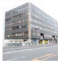
3 モンビル横浜根岸