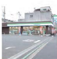
5 ファミリーマート根岸駅北店