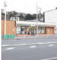
10 セブンイレブン 横浜根岸3丁目店