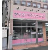
11 さくらT'sクリニック