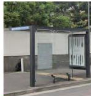
13 根岸七曲り下バス停