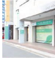
4 デンタルライフクリニック