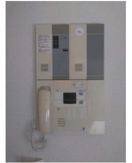
オートロック機械設備