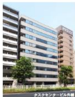
タスクセンタービル外観