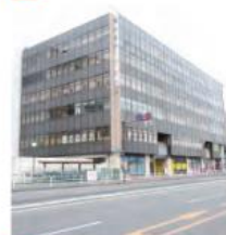
3 モンビル横浜根岸