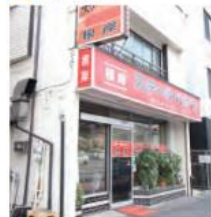
9 スターキハウス根岸