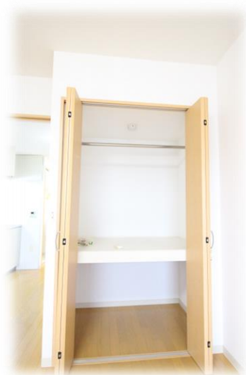
・洋室に大きなクローゼット