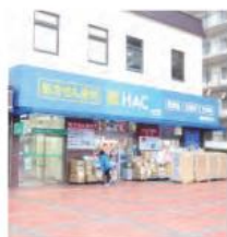
2 ハックドラッグ根岸駅前店