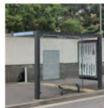
13 根岸七曲り下バス停