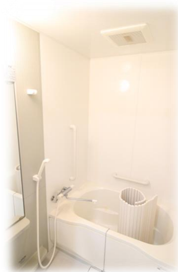
・ゆったりとした浴室