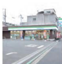
5 ファミリーマート根岸駅北店