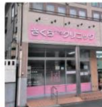
11 さくらT'sクリニック