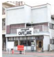
16 自家焙煎珈琲カフェハンス