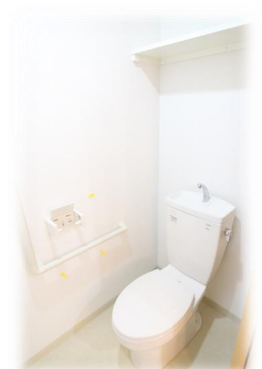
・横幅にゆとりのあるトイレ