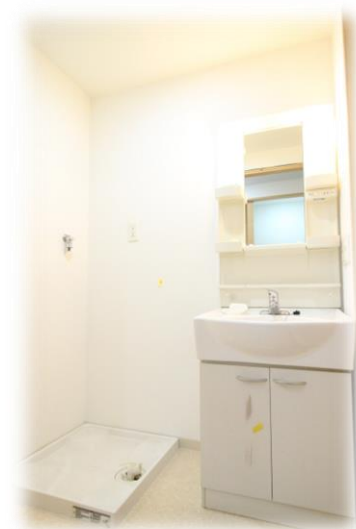
・収納スペースの多い独立洗面台