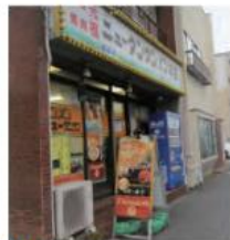
12 元祖ニュータンタンメン本舗 根岸店