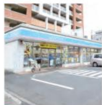
6 ローソン 横浜磯子東町店