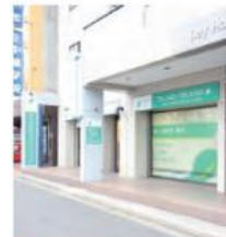
4 デンタルライフクリニック