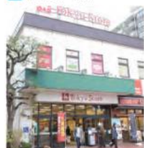
1 東急ストア 根岸店