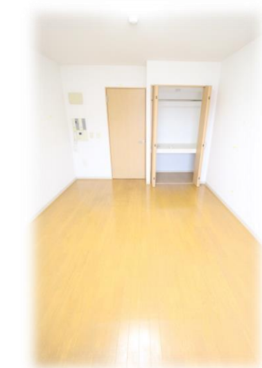
・配置がしやすく明るい洋室