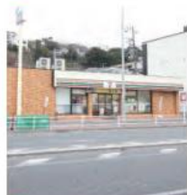
10 セブンイレブン 横浜根岸3丁目店