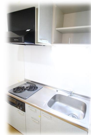
・グリル付システムキッチン